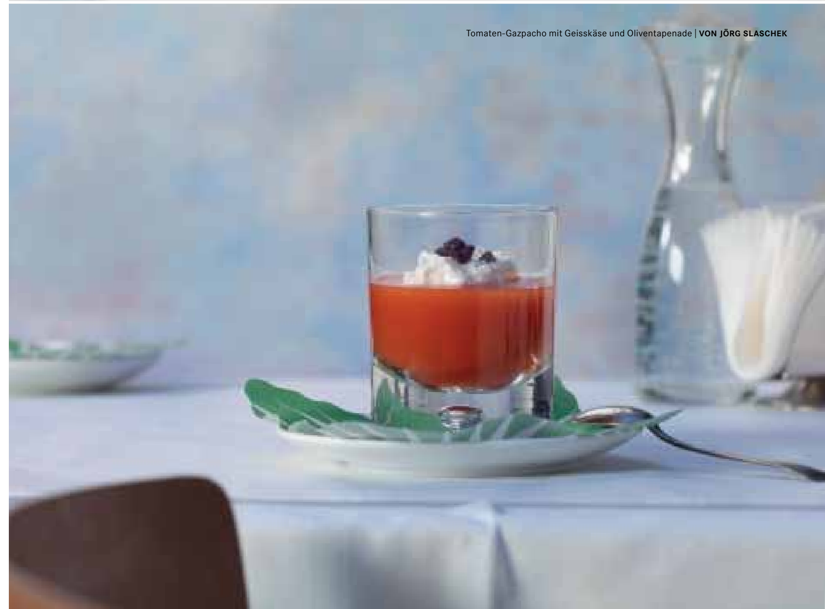
Tomaten-Gazpacho mit Geisskäse und Oliventapenade | VON JÖRG SLASCHEK