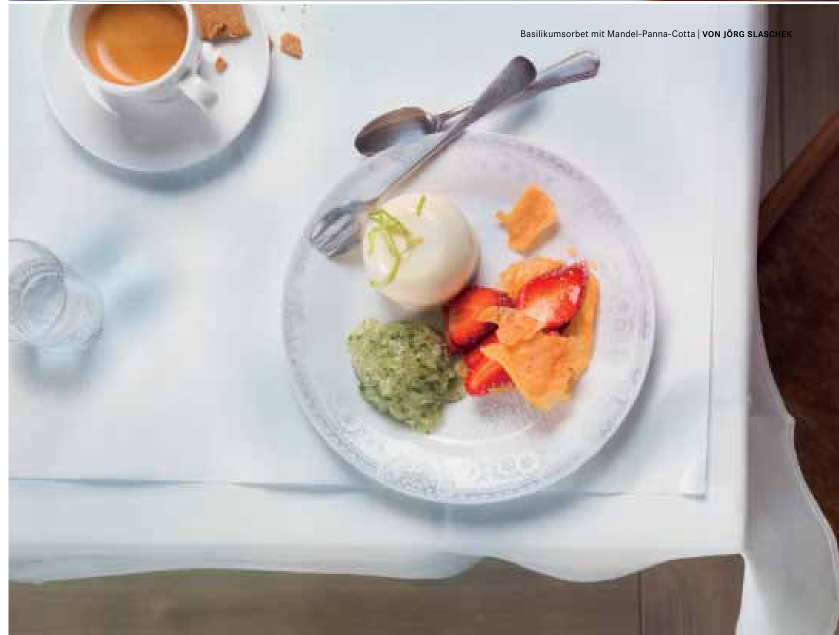
Basilikumsorbet mit Mandel-Panna-Cotta | VON JÖRG SLASCHEK